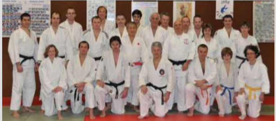
Les pratiquants du cours adultes entourent le champion du monde.