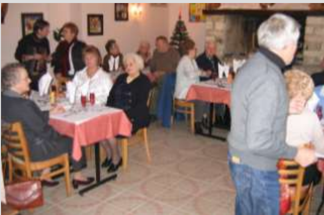
Le repas de l'Amicale le 23 janvier 2010.

Ensuite, le dimanche 7 février 2010, comme chaque année, la municipalité de Fleurines a invité les Fleurinois de plus de 65 ans au repas traditionnel de la nouvelle année.