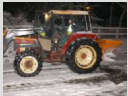
Le tracteur municipal, équipé pour le salage, à l'œuvre au petit matin dans les rues fleurinoises.

Si l'on se rappelle que depuis des années la consommation annuelle de sel ne dépasse pas les 3 ou 4 tonnes pour la commune, on imagine volontiers les conditions auxquelles nous avons dû faire face cette année.