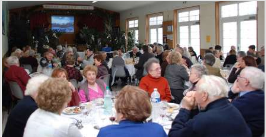
Une salle des Fêtes bien remplie pour le repas de la Mairie le 7 février 2010.

La bonne humeur était au rendez-vous, les souvenirs de chacun ont été évoqués, bien sûr nous avons eu une pensée pour nos amis disparus et également pour ceux absents, en voyage ou en soins.