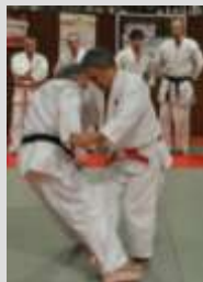
Le Maître en action.