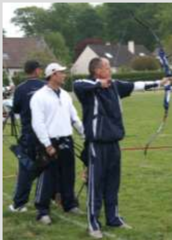
L'équipe arc classique de Fleurines.