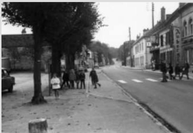
La place de l'Église dans les années soixante.