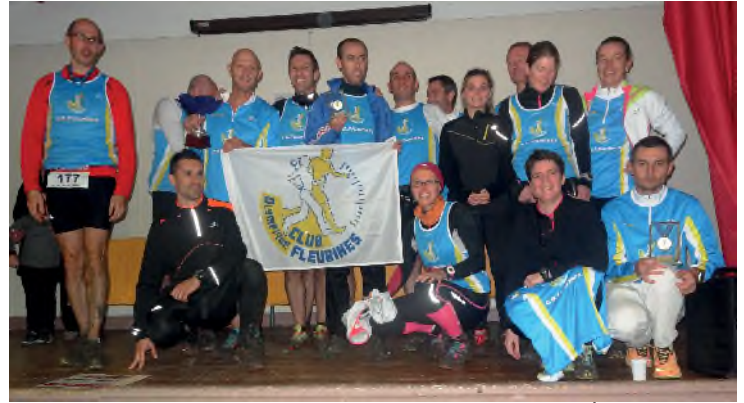
Podium au TLE

A cette occasion les enfants pourront participer à une parade des engins à pédales (voiturettes, vélos, trottinettes, caisses à savon et tous types d'engins nés de l'imagination).