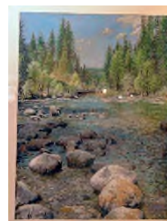
Le lac vert