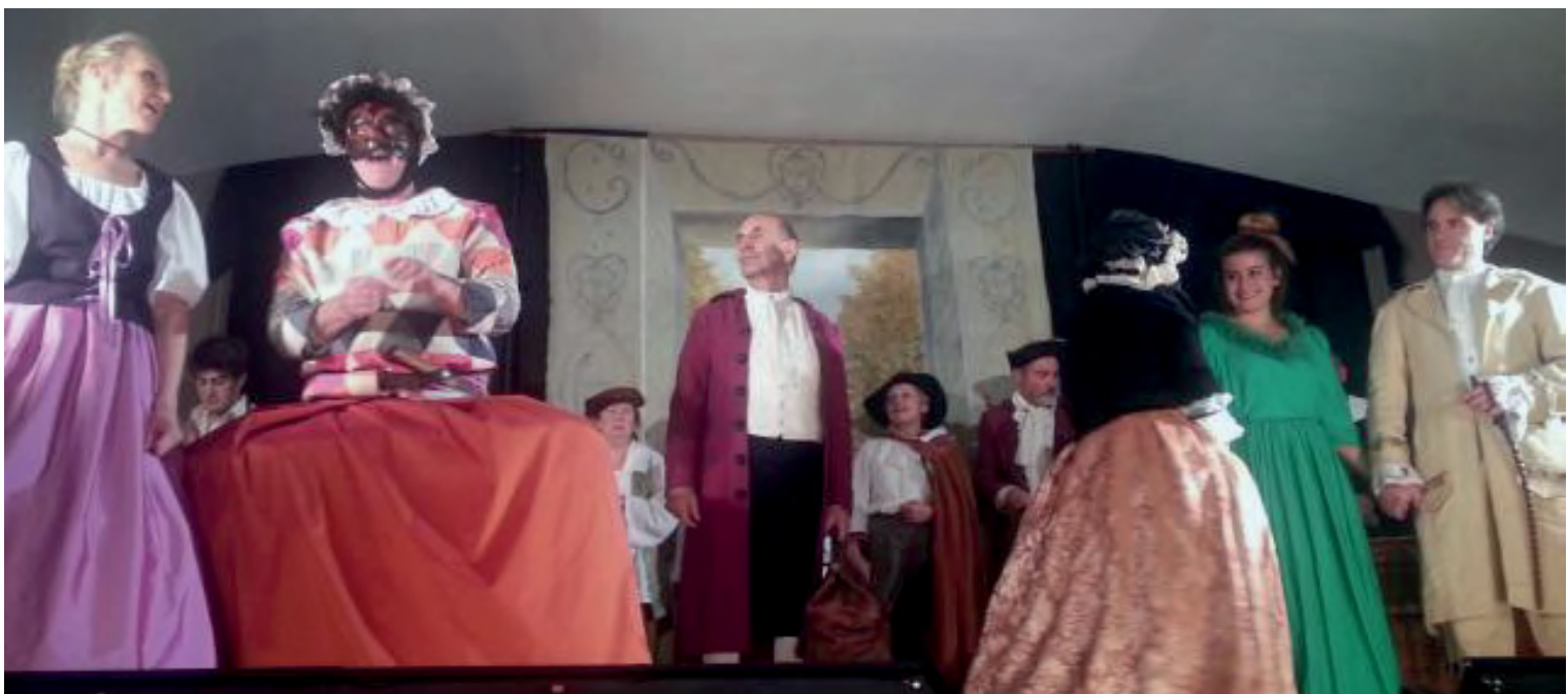
Spectacle 21 et 22 novembre 2014 « La Tête noire » de A R Lesage