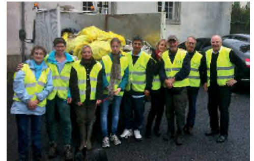
L'équipe des bénévoles

Bravo et merci aux personnes qui ont contribué, malgré la pluie, à rendre notre village plus propre et donc plus agréable à vivre.