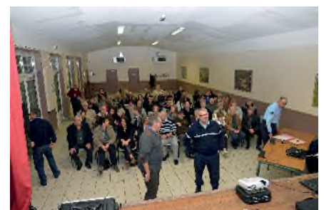
Réunion publique du 14 novembre

Certaines rues et lotissements attendent des référents : rues Saint Christophe, Molière, la rue de l'Eglise et la rue de la Vallée, Les Grands Prés, Le Fief, Les Grouettes et Le Clos des Acacias.