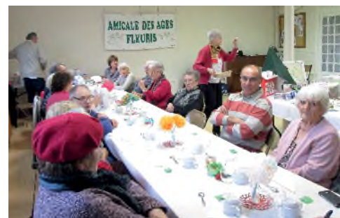
Goûter - loto des Ages Fleuris

Les spectateurs ont beaucoup aimé le jeu des acteurs, en particulier les péripéties comiques du personnage « Arlequin ».