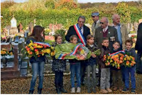
Dépose de gerbes par les enfants

L'anniversaire de la signature de l'armistice du 11 Novembre 1918 a rassemblé cette année un très grand nombre de Fleurinois !