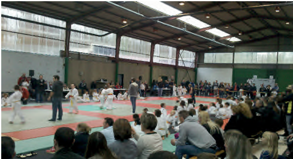
La compétition du 15 novembre

Un remerciement particulier est adressé au restaurant La Traviata, partenaire du club.